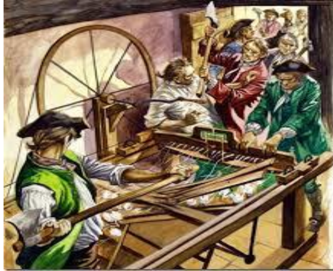
Figura 1 - distruzione di un telaio meccanico

disperazione dalla marcia della rivoluzione industriale, che creava macchine via via più progredite e meno bisognose di mano d' opera.